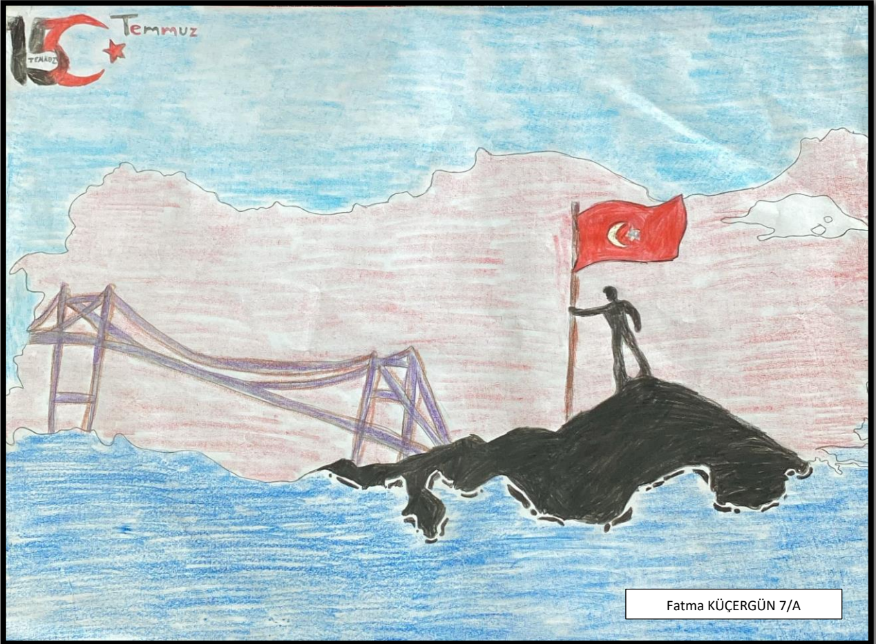
Fatma KÜÇERGÜN 7/A