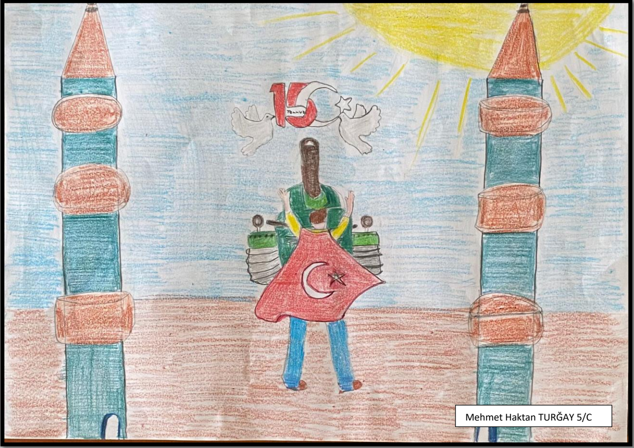
Mehmet Haktan TURĞAY 5/C